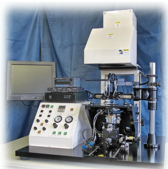
(改良のため仕様◆意匠は変更されることがあります)